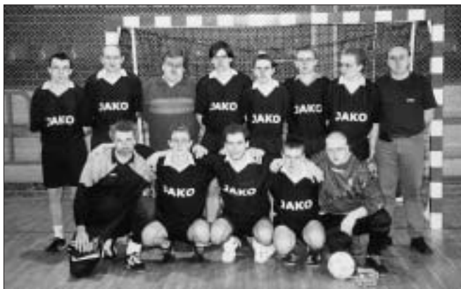
Toto mužstvo vybojovalo 1. ligu.

To boli slová predsedov senickej sálovky. „Vy Búrania hráte pekny kombinacny futbal. Nenakopu-