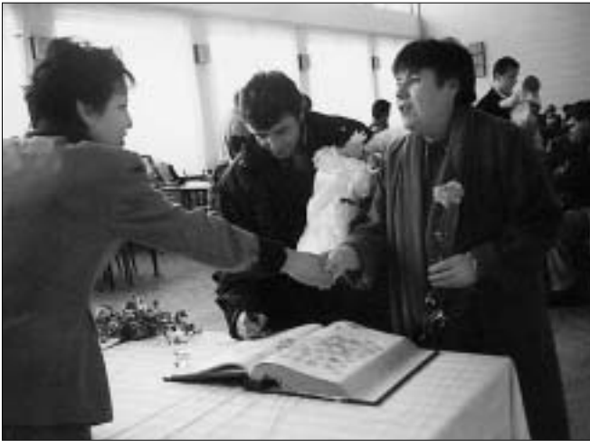
V nedeľu 9. februára 2003 sa uskutočnilo v Kultúrnom dome Borský Mikuláš slávnostné uvítanie našich malých občianok - narodených v roku 2002 - do života. Všetkým želáme veľa zdravia, krásne mierové detstvo a neskonajú lásku rodičov.